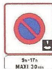
B6b3 + M6c

Zone à stationnement de durée limitée à 30 minutes avec contrôle par disque « bleu »